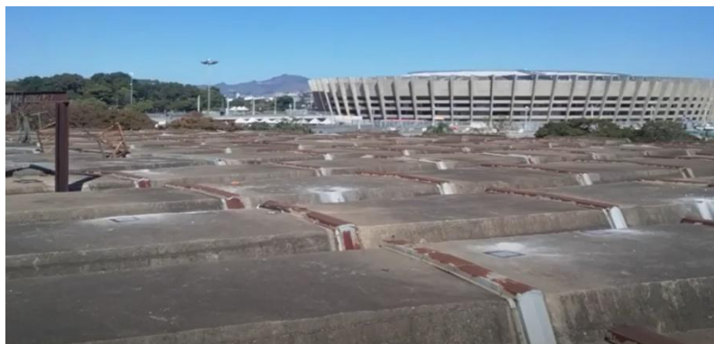
Imagem 04 – Cobertura

4.11.11. correção de qualquer anomalia no concreto armado.