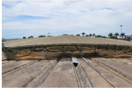
Imagem 01 - Cúpula

4.11.2. remoção e inserção da estrutura, reparos estruturais, reparos de solda, de travamento e rigidez;