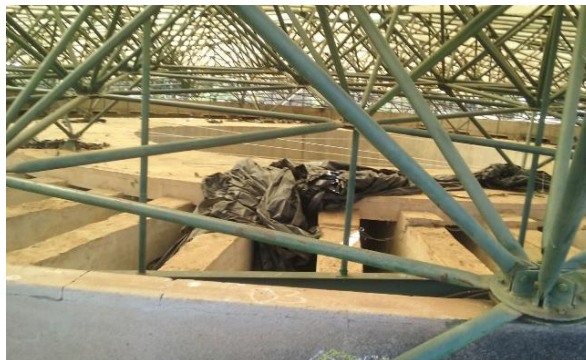
Imagem 02 – Ferragens Cúpula

4.11.3. pintura total, em tinta à base de esmalte, recolocada no mesmo local e fixada sobre as estruturas de apoio em concreto, de forma definitiva e segura;